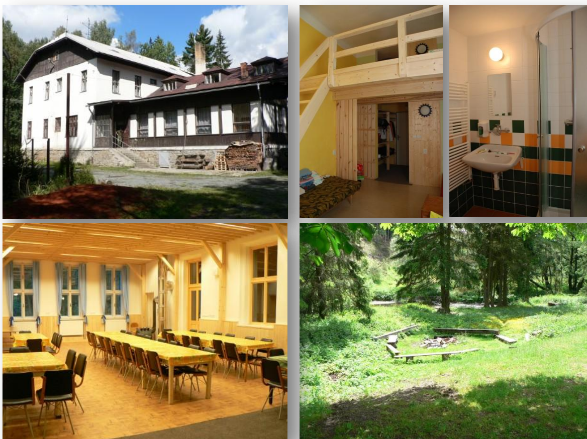
hlavní vstup do budovy, pohled do pokoje a koupelny, jídelna, táborový kruh